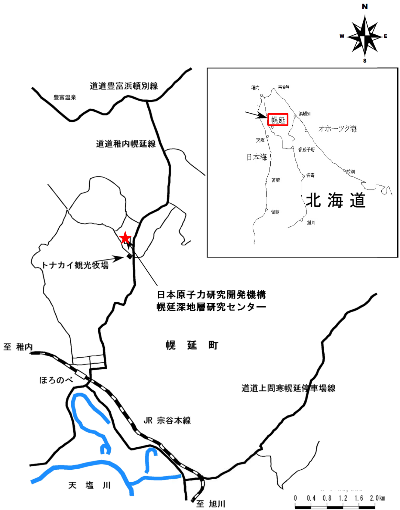
図-1 幌延深地層研究センター位置図