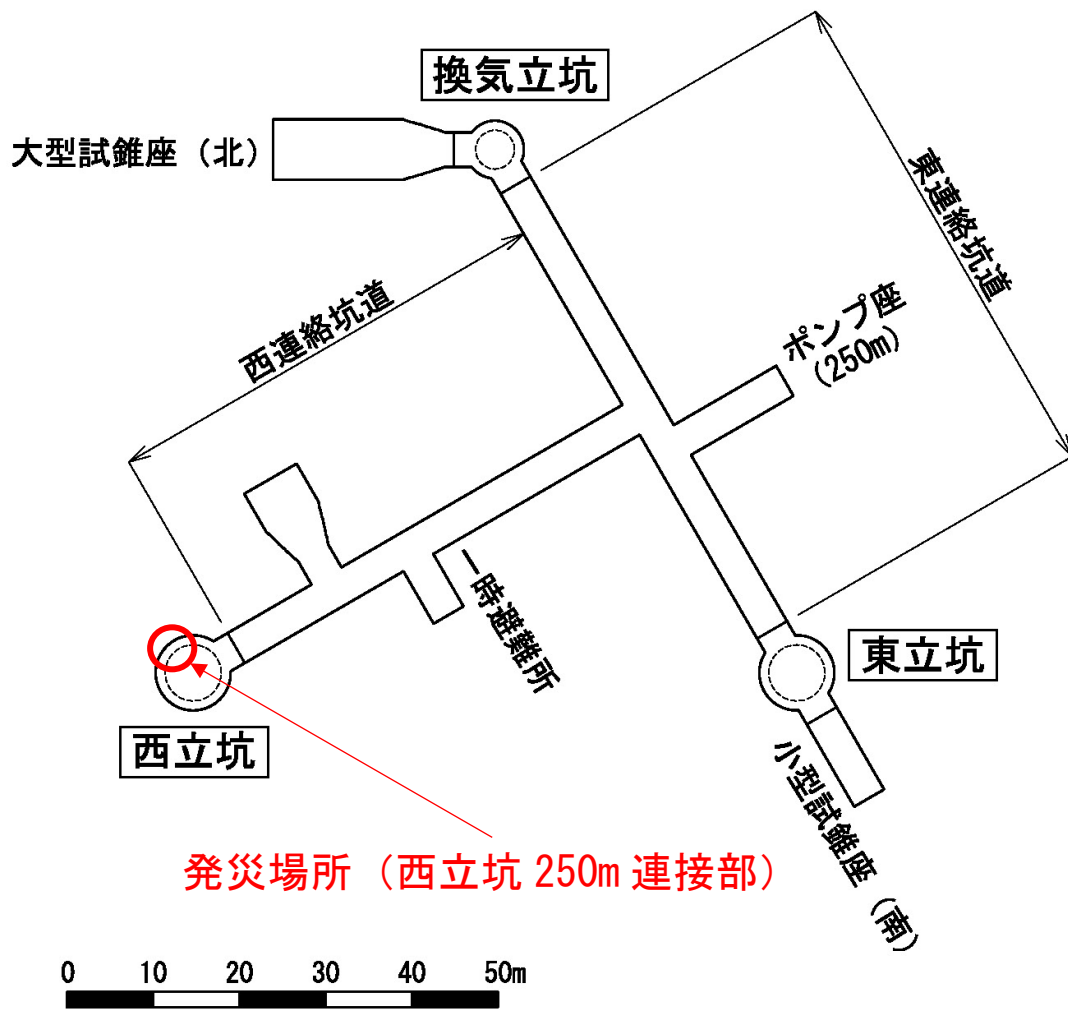
図-3 発災場所 (地下 250m 調査坑道)